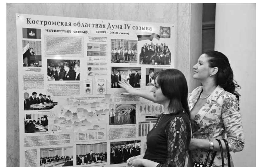
Всего в экспозиции - восемь витрин

ском Таврическом Дворце под портретом императора наставляли на создании государственного земельного фонда. И это их «младшие» то-