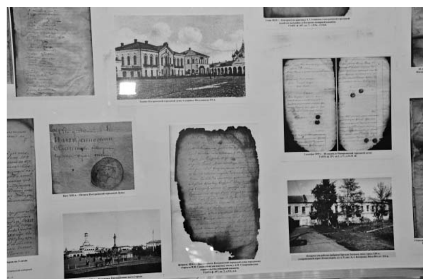
На выставке - уникальные «думские» документы начала XIX века

«законосовещательная» Государственная Дума), как в Костромском уезде моментально наметилась выборки. Целая очередь: присяж-