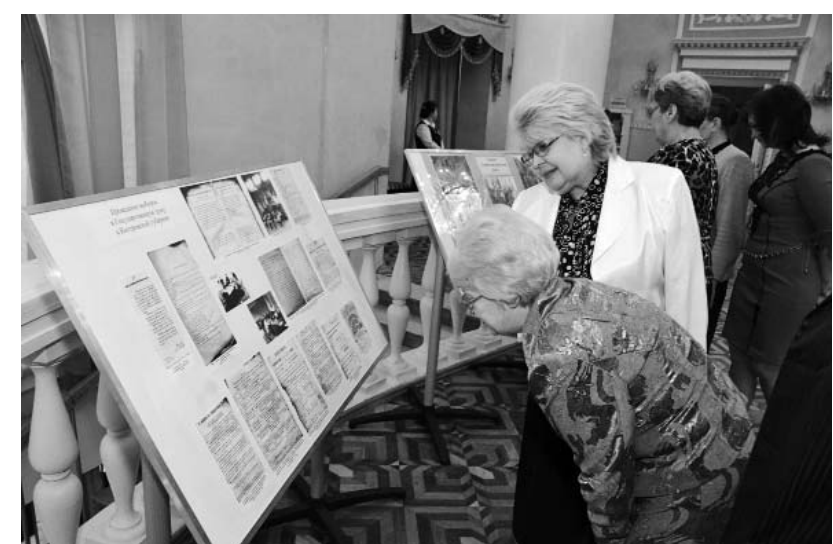
История Думы, как и любая история, требует пристального изучения

встречали не очень-то искренне. «Настоящее собрание Думы не отозвалось многолюдством», – сетует одна из костромских газет