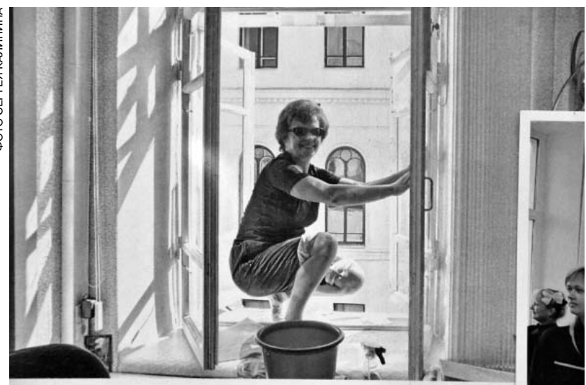
Субботник в Думе